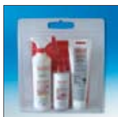
Nr./No. 1 09 62 Set

Inhoud: 250 ml steenreiniger, 250 ml steenimpregneer, 250 ml politoer, 1 spons, 1 polierdoek, 1 stofdoek, 1 paar handschoenen, 1 beker, 1 kwast