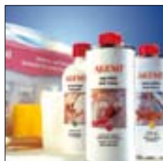
Nr./No. 1 08 09 Set