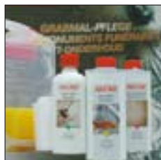
Nr./No. 1 09 02 Set

Inhoud: 250 ml reiniger, 250 ml AFW, 250 ml politoer, 1 spons, 1 polierdoek, 1 stofdoek, 1 paar handschoenen