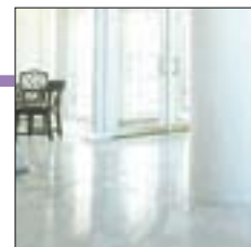
Nr./No. 1 08 48 5000 ml